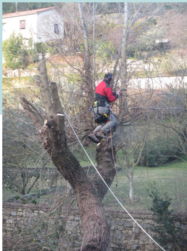
Démontage de l'arbre