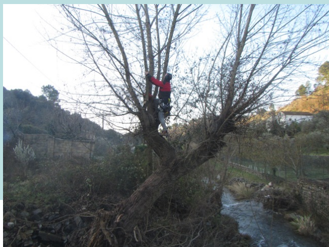
Démontage de l'arbre

- Démontage, évacuation et billonnage en haut de berge