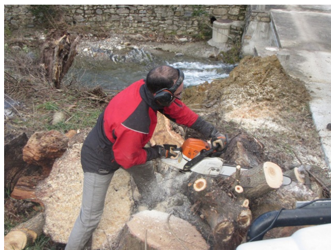
Démontage de l'arbre